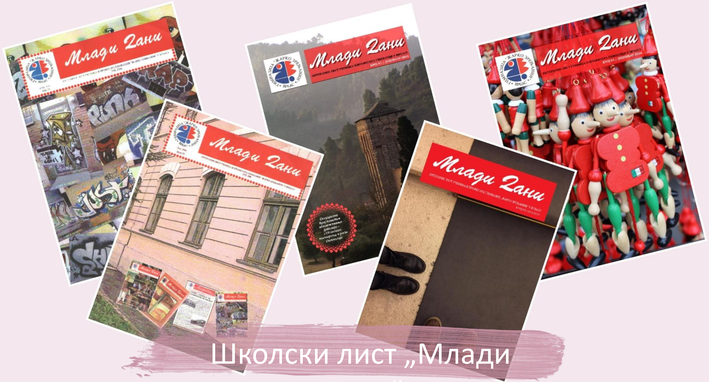
Школски лист „Млади Дани“